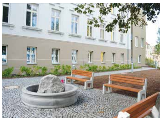
Upravený je i areál před hospicem.