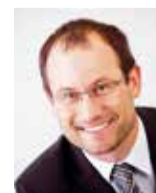
Jan Farský Poslanec PSP ČR za Liberecký kraj

Vypadá to, že základní slib, s kterým jsem šel do voleb, se podaří splnit. Další oblastí, které se chci věnovat, je debyrokratizace. Rušení zbytečných a nesmyslných povinností, které dělají státní správu nejen drahou, ale hlavně tak složitou, že už se v ní málokdo vyzná.