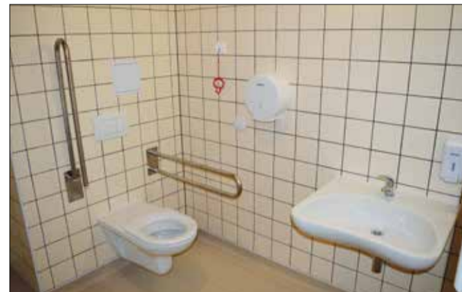
Sociální zařízení je přizpůsobeno potřebám nemocných.