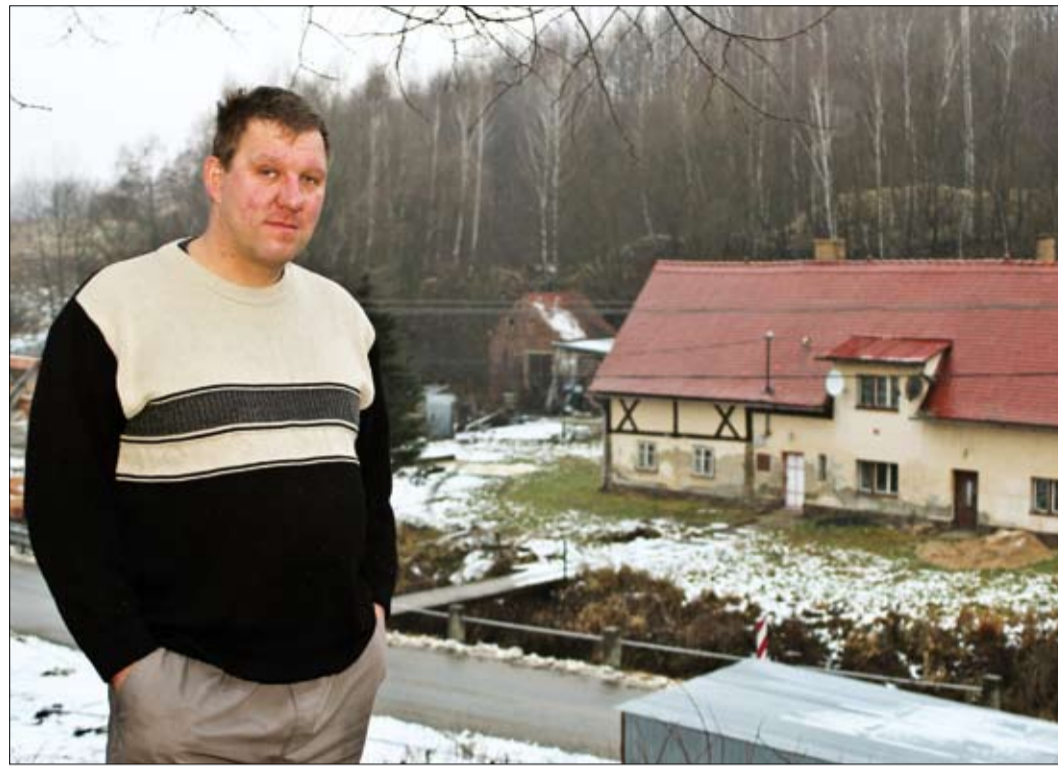
Starosta Stříbrný nad svou vsí

Moje politické ambice nejsou nijak velké. A do kraje jdu jenom z toho důvodu, aby Frýdlantsko mělo na kraji svého zástupce. V současnosti má v zastupitelstvu LK jednoho zástupce, z města Frýdlantu, a je to strašně málo. Jeden člověk tam nic nezmuže. Protože mi osud Frýdlantska není lhostejný, rozhodl jsem se kandidovat do krajského zastupitelstva. Ale moje ambice nejsou být v radě. Já chci nadále zůstat tady starostou, pokud mě občané budou volit.