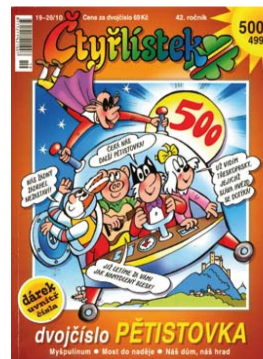
Slavný komiks vychází už 43 let!